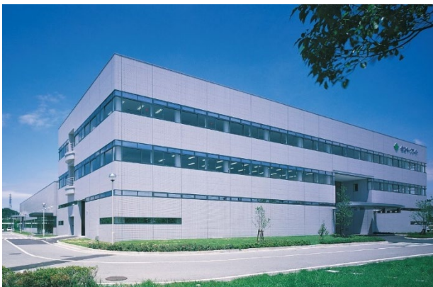
神戸事業所(外観写真)