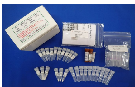
EZGlyco® O-Glycan Prep Kit 製品イメージ

Biochemical and Biophysical Research Communications , 2019 (in press, open access)