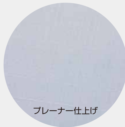
プレーナー仕上げ

すべり力測定方法 ※一般的に物を切るときに手で押さえつける力 (2.8kg) を想定。