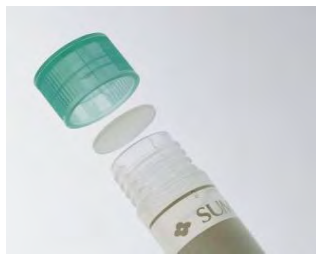
【アウターキャップ】