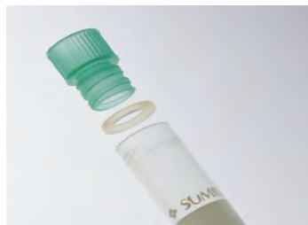
【インナーキャップ】