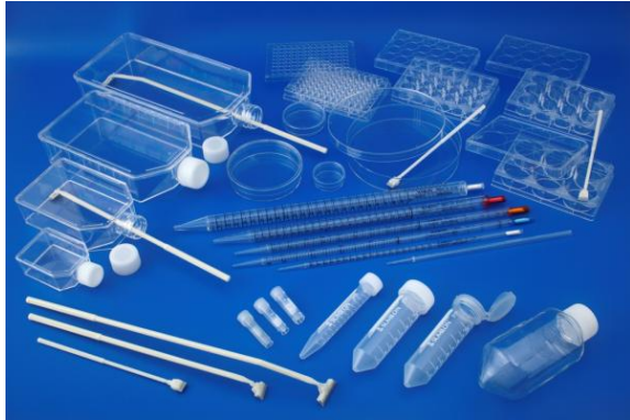
スミロンスーパークオリティ シャーレ包装例