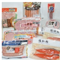
深絞り包装用フィルム エコシール ECOCeeel ®

こうしてゴミを少なく、バランスのいい消費を工夫する精神は、住友ベークライトの食品用透明フィルム「ECOCeeel ® （エコシール）」にも活かされています。強く薄く、20%も軽量になった多層構造の機能フィルムで、食品ゴミ全体を減らす、環境にやさしい食品包装材です。