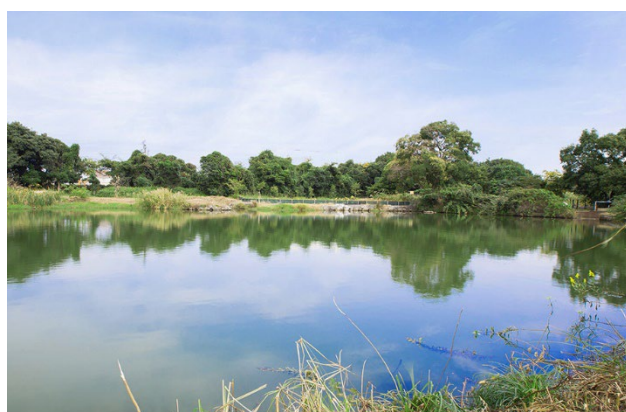
静岡工場内ビオトープ『憩いの杜』