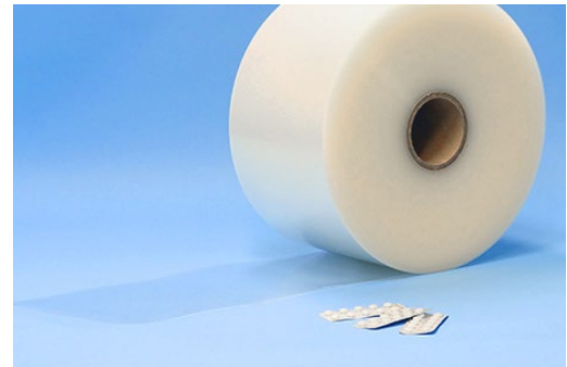
スミライト®NS シリーズ